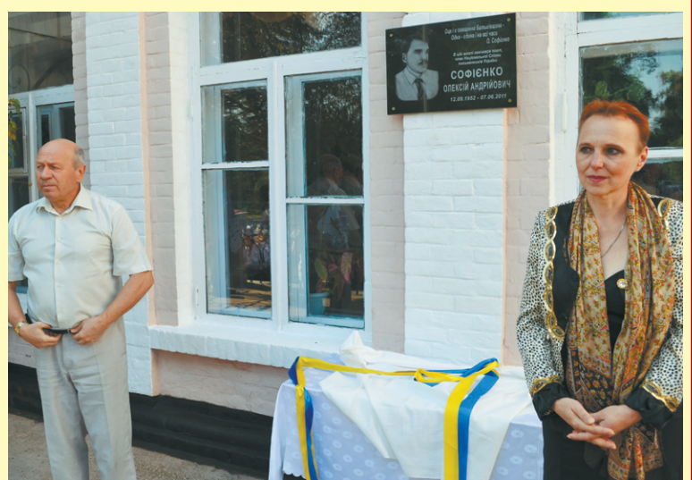
Відкриття меморіальної дошки на честь поета на приміщенні школи