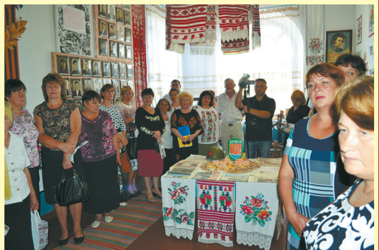
Відбулася цікава екскурсія, під час якої присутні ознайомилися з музейними з експозиціями та доторкнулися до історії села Степанівка