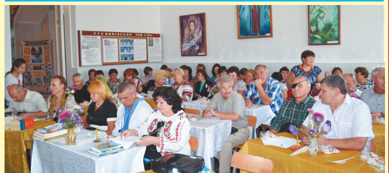
На Софієнківських читаннях у літературній вітальні