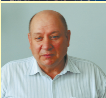
Звучить творчість Володимира Ткаченка